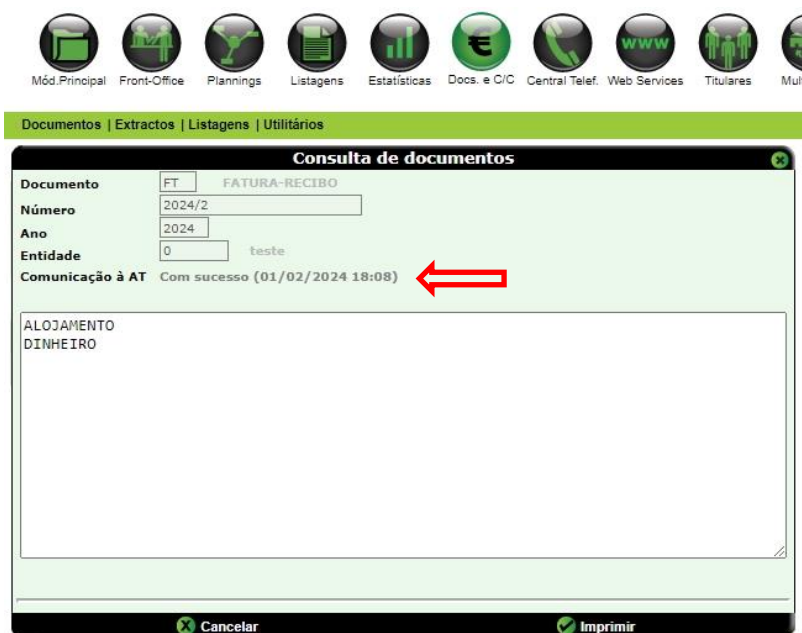
Figura 2 – Comunicação de documento à AT